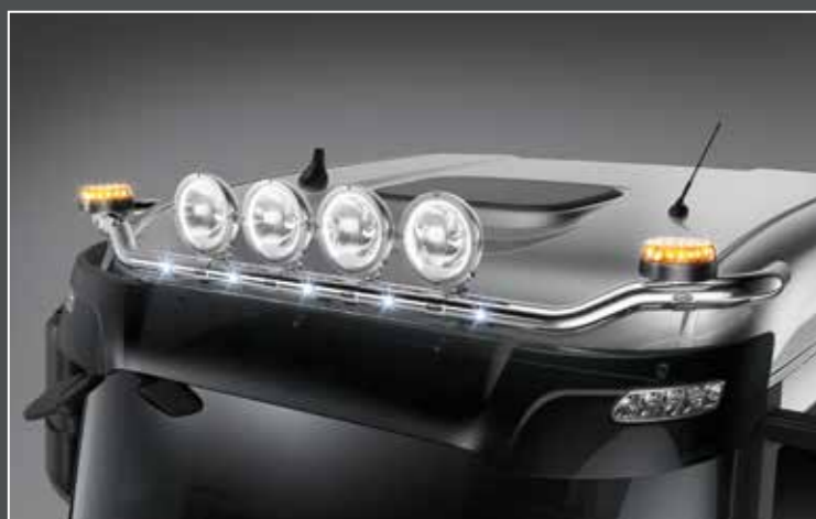
27706-1-P - LightFix - SKY-LIGHT "WING" Barra portafari per il montaggio fino a 6 fari ausiliari e 2 rotanti acciaio inossidabile lucidato a mano - Ø 70mm - al 100% predisposto con cablaggio