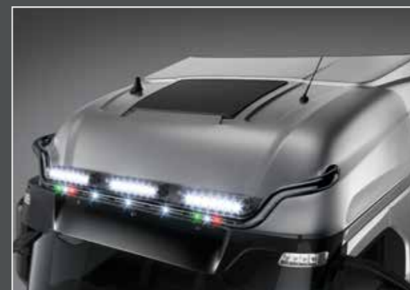
27705-4-B - LightFix - SKY-LIGHT "WING" Barra portafari per il montaggio fino a 6 fari ausiliari e 2 rotanti acciaio inossidabile verniciato nero - Ø 70mm al 100% predisposto con cablaggio