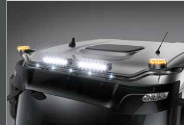
27706-1-B - LightFix - SKY-LIGHT "WING" Barra portafari per il montaggio fino a 6 fari ausiliari e 2 rotanti acciaio inossidabile verniciato nero - Ø 70mm al 100% predisposto con cablaggio