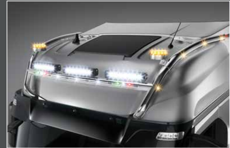
27705-5-P - LightFix - SKY-LIGHT "MAX"

Barra portafari in acciaio inox adatto per il montaggio fino a 6 fari ausiliari e 2 rotanti acciaio inossidabile lucidato a mano - Ø 70mm - al 100% predisposto con cablaggio nei lati si trovano LED in arancioni e in rosso