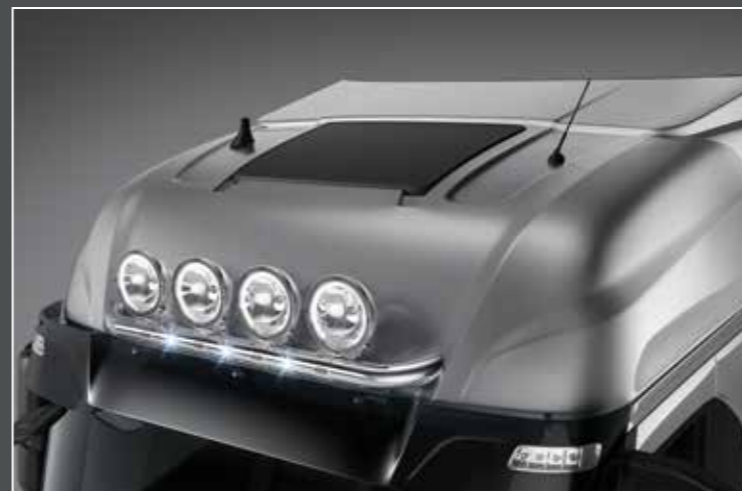
27705-1-P - LightFix - SKY-LIGHT "VISOR"

Barra portafari per il montaggio fino a 2 fari ausiliari e 2 rotanti acciaio inossidabile lucidato a mano - Ø 70mm - al 100% predisposto con cablaggio