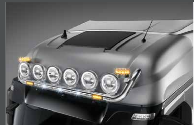
27705-3-P - LightFix - SKY-LIGHT "U"

Barra portafari per il montaggio proiettori LED integrati acciaio inossidabile lucidato a mano - Ø 70mm - al 100% predisposto con cablaggio