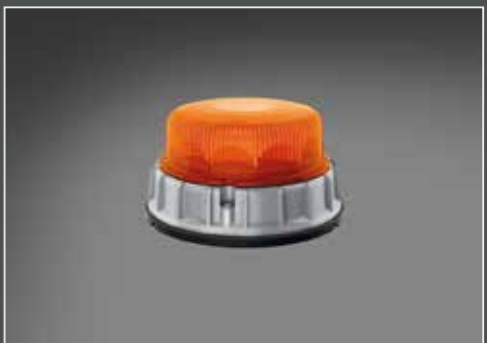
Set a 2, altezza montaggio 87,6mm e Ø 169,3mm, arancione BOX2-K-LED-2.0