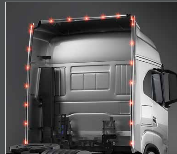
27748-9-P /-B - LightFix - ROOF-LINER - AS-High Barra portafari per fino a 4 fari da lavoro e 2 rotanti per il spoiler della cabina acciaio lucidato a mano o verniciato nero - Ø 70mm - al 100% predisposto con cablaggio completo di LED rossi