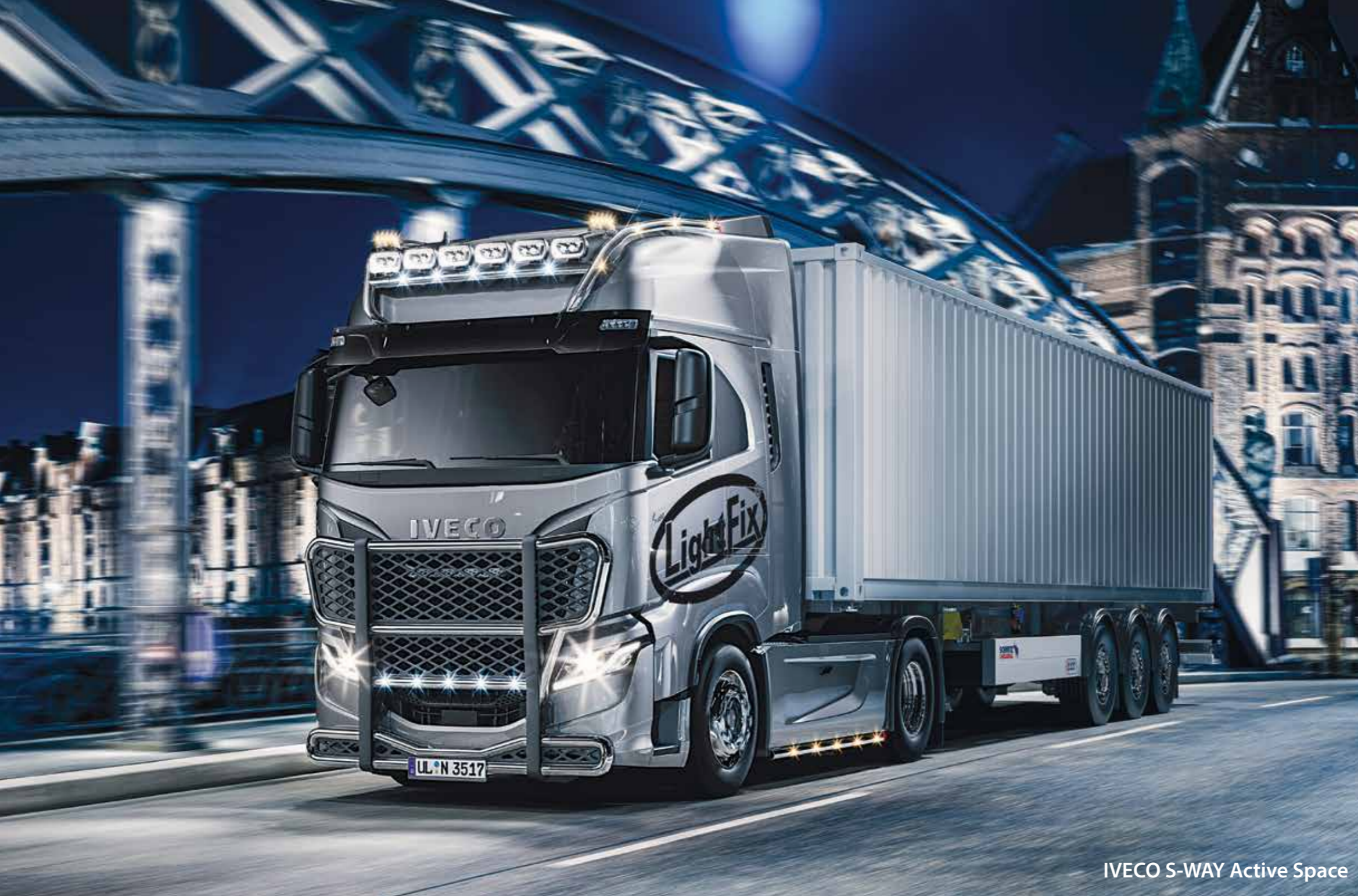
IVECO S-WAY Active Space