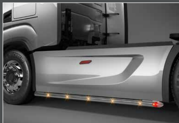
27740-6-P /-B - 27740-7-P /-B - LightFix - SIDE-LINER WB 3650mm (27740-6-P /-B) / WB 3800mm (27740-7-P /-B) Barra laterale (set) in acciaio inossidabile lucidato a mano oppure verniciato nero Ø 60mm - al 100% predisposto con cablaggio e spina di connessione incl. LED rossi alle estremità del tubo e LED arancioni ai lati