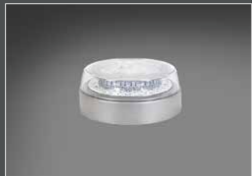
Set a 2, altezza montaggio 69mm e Ø 165mm, trasparente BOX2-LF-LED100-T