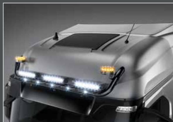
27705-3-B - LightFix - SKY-LIGHT "U" Barra portafari per il montaggio fino a 6 fari ausiliari e 2 rotanti acciaio inossidabile verniciato nero - Ø 70mm al 100% predisposto con cablaggio