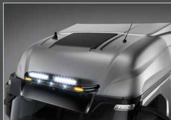
27705-1-B - LightFix - SKY-LIGHT "MINI" Barra portafari per il montaggio fino a 4 fari ausiliari acciaio inossidabile verniciato nero - Ø 70mm al 100% predisposto con cablaggio