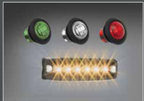
LED di posizione LightFix oppure luce stroboscopica a LED integrato nel tubo