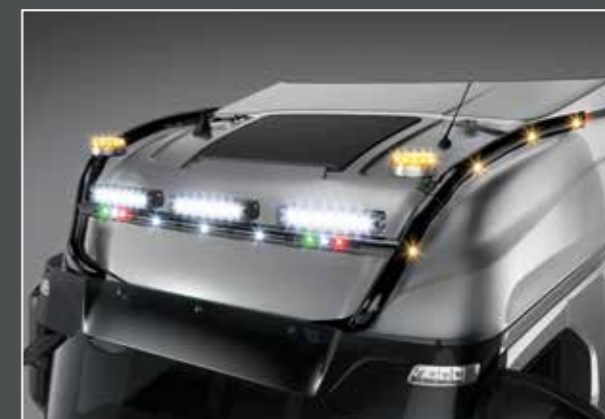
27705-5-B - LightFix - SKY-LIGHT "MAX" Barra portafari per il montaggio fino a 6 fari ausiliari e 2 rotanti acciaio inossidabile verniciato nero - Ø 70mm al 100% predisposto con cablaggio nei lati si trovano LED in arancioni e in rosso