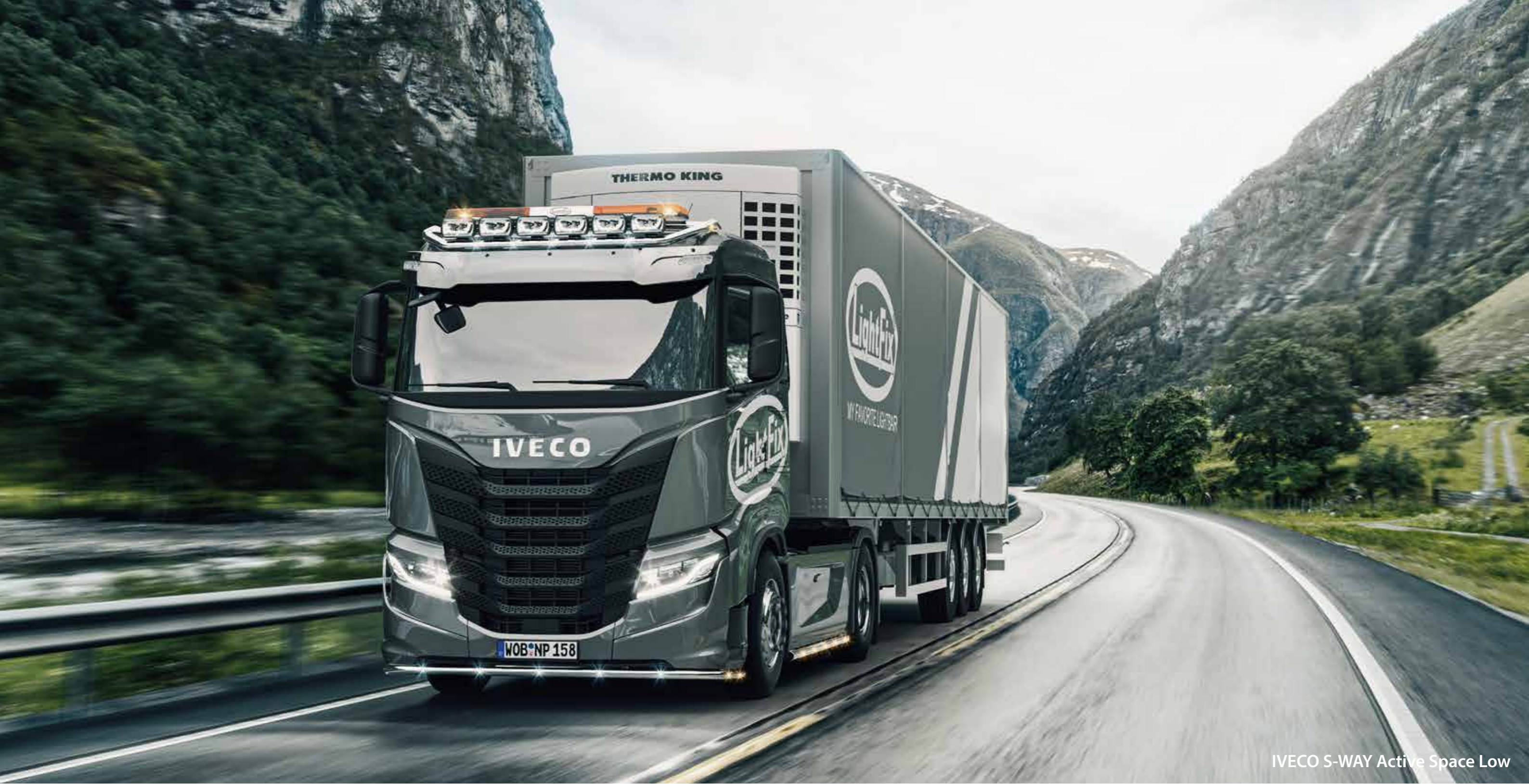
IVECO S-WAY Active Space Low