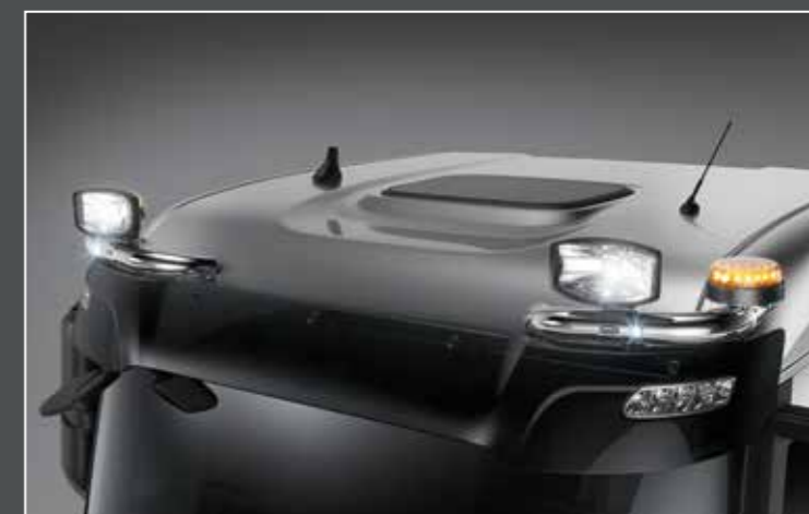
27706-5-P - LightFix - SKY-EYES Barra portafari per il montaggio fino a 2 fari ausiliari e 2 rotanti acciaio inossidabile lucidato a mano - Ø 70mm - al 100% predisposto con cablaggio