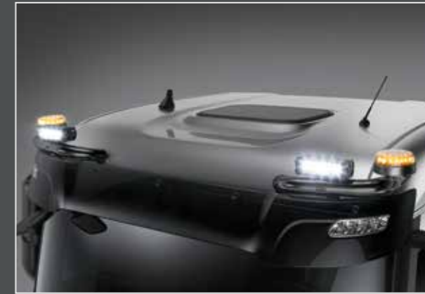
27706-5-B - LightFix - SKY-EYES Barra portafari per il montaggio fino a 2 fari ausiliari e 2 rotanti acciaio inossidabile verniciato nero - Ø 70mm al 100% predisposto con cablaggio