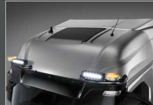
27705-6-B - LightFix - SKY-EYES Barra portafari per il montaggio fino a 2 fari ausiliari e 2 rotanti acciaio inossidabile verniciato nero - Ø 70mm al 100% predisposto con cablaggio