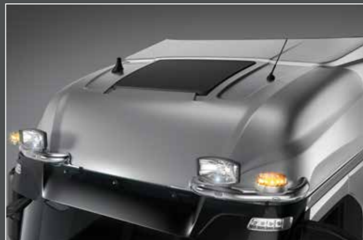
27705-6-P - LightFix - SKY-EYES

Barra portafari per il montaggio fino a 6 fari ausiliari e 2 rotanti acciaio inossidabile lucidato a mano - Ø 70mm - al 100% predisposto con cablaggio