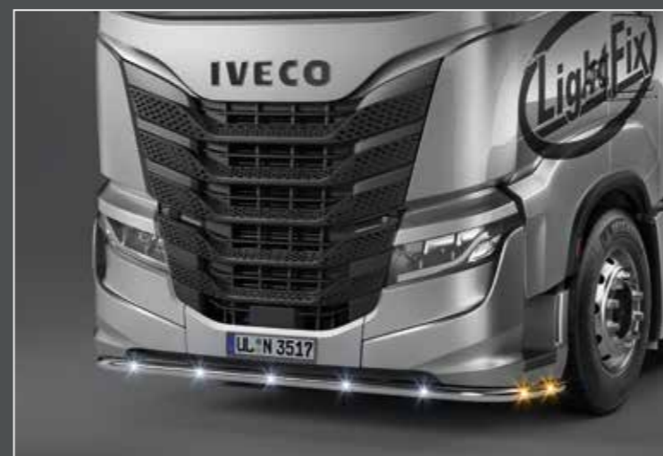
27740-2-P /-B - LightFix - FRONT-LINER "N" Tubo inferiore in acciaio inossidabile lucidato a mano oppure verniciato nero Ø 60mm - al 100% predisposto con cablaggio completo di LED bianchi e LED arancioni