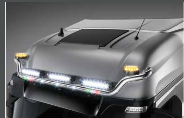
27705-4-P - LightFix - SKY-LIGHT "WING"

Barra portafari in acciaio inox adatto per il montaggio fino a 6 fari ausiliari e 2 rotanti acciaio inossidabile lucidato a mano - Ø 70mm - al 100% predisposto con cablaggio nei lati si trovano LED in arancioni e in rosso