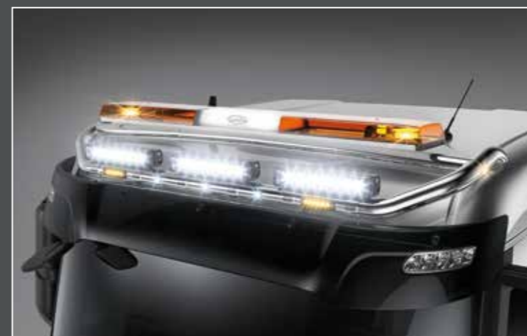
27706-4-P - LightFix - SKY-LIGHT + SKY-BRIDGE Barra portafari con un tubo trasversale per il montaggio fino a 6 fari ausiliari e una barra segnaletica acciaio inossidabile lucidato a mano - Ø 70mm - al 100% predisposto con cablaggio