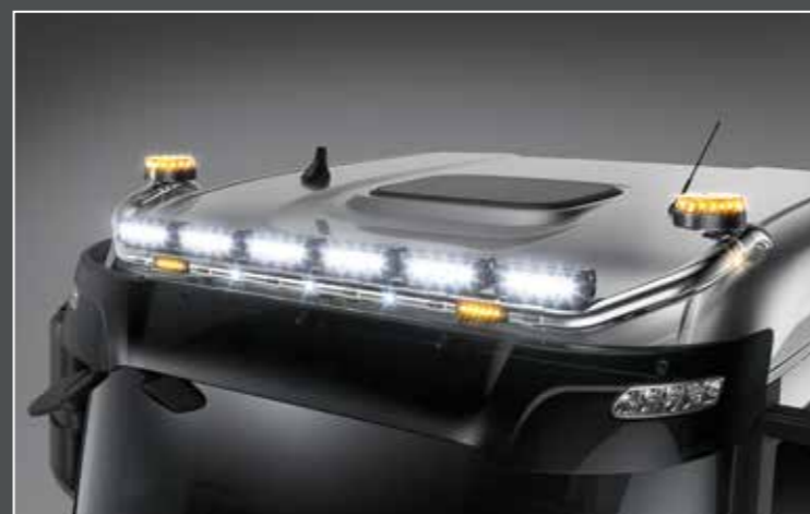
27706-2-P - LightFix - SKY-LIGHT "U" Barra portafari per il montaggio fino a 6 fari ausiliari e 2 rotanti acciaio inossidabile lucidato a mano - Ø 70mm - al 100% predisposto con cablaggio