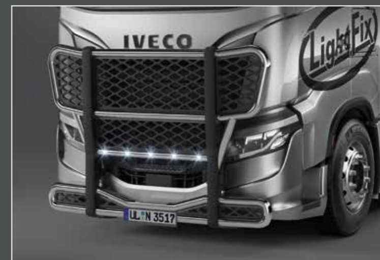
27760-2-P /-B - LightFix - FRONT-PROTECT "BIG NORDIC" Griglia frontale con una rete in nero - acciaio inossidabile acciaio lucidato a mano o verniciato nero - Ø 70mm - al 100% predisposto con cablaggio 29708-1-P /-B - LightFix - LAZER-BRIDGE per Lazer Triple-R 1000 integrato