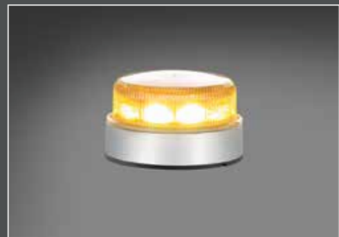
Set a 2, altezza montaggio 88mm e Ø 149mm, arancione BOX2-K-LED-BZ