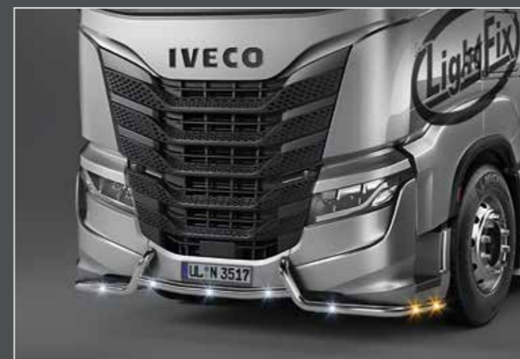
27740-3-P /-B - LightFix - FRONT-LINER "S" Tubo inferiore in acciaio inossidabile lucidato a mano oppure verniciato nero Ø 60mm - al 100% predisposto con cablaggio completo di LED bianchi e LED arancioni