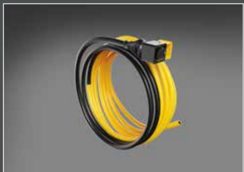
29290-6 cavo connettore (a 8-poli)