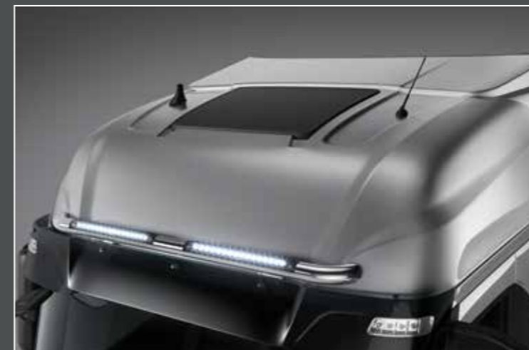
27705-2-P - LightFix - SKY-LIGHT "SLIM"

Barra portafari per il montaggio fino a 4 fari ausiliari acciaio inossidabile lucidato a mano - Ø 70mm - al 100% predisposto con cablaggio