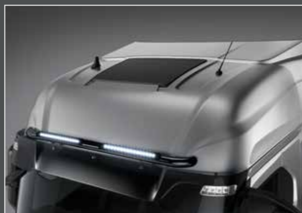
27705-2-B - LightFix - SKY-LIGHT "SLIM" Barra portafari per il montaggio proiettori LED integrati acciaio inossidabile verniciato nero - Ø 70mm al 100% predisposto con cablaggio