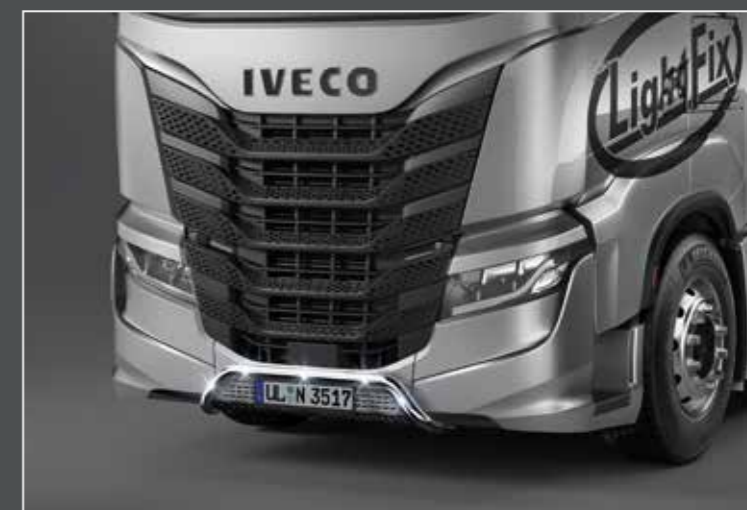
27741-1-P /-B - LightFix - FRONT-LINER "TARGA" Tubo inferiore frontale in acciaio lucidato a mano oppure verniciato nero Ø 60mm - al 100% predisposto con cablaggio completo di LED bianchi